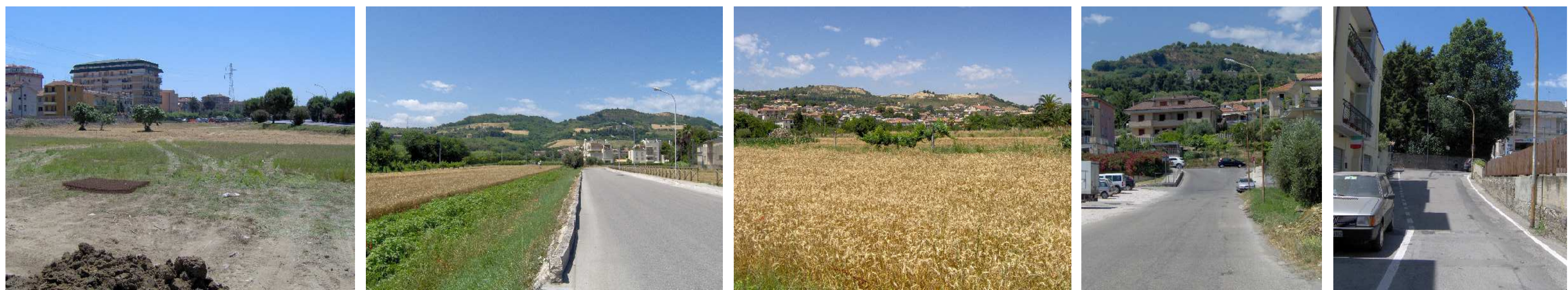
VISTE morfologia del sito 1 2 3 4 5