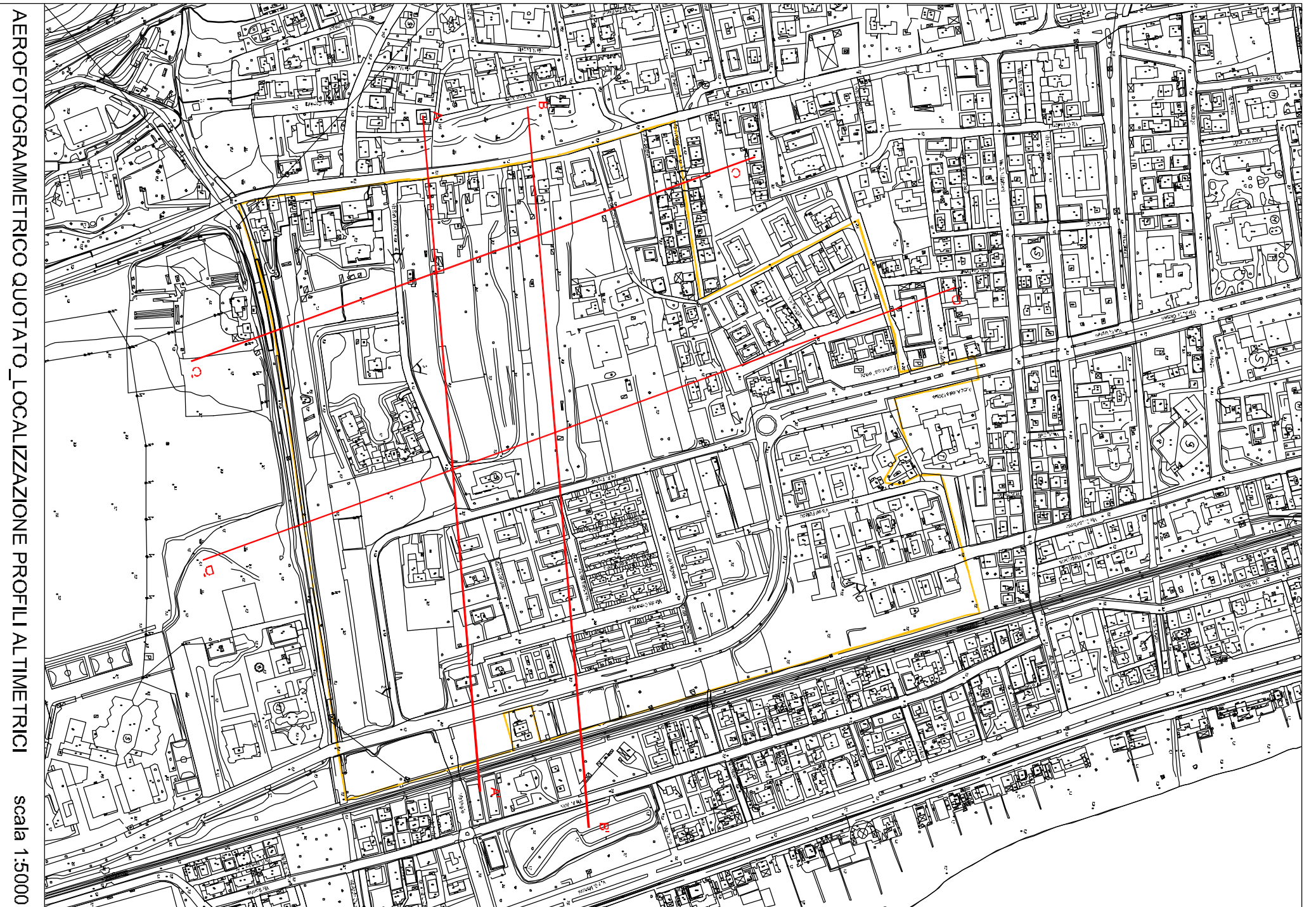
AEROFOTOGRAFIMETRICO QUOTATO LOCALIZZAZIONE PROFILI ALTIMETRICI scala 1:5000