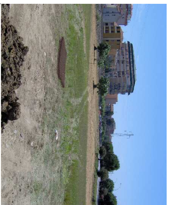
VISTE morfologia del sito 1