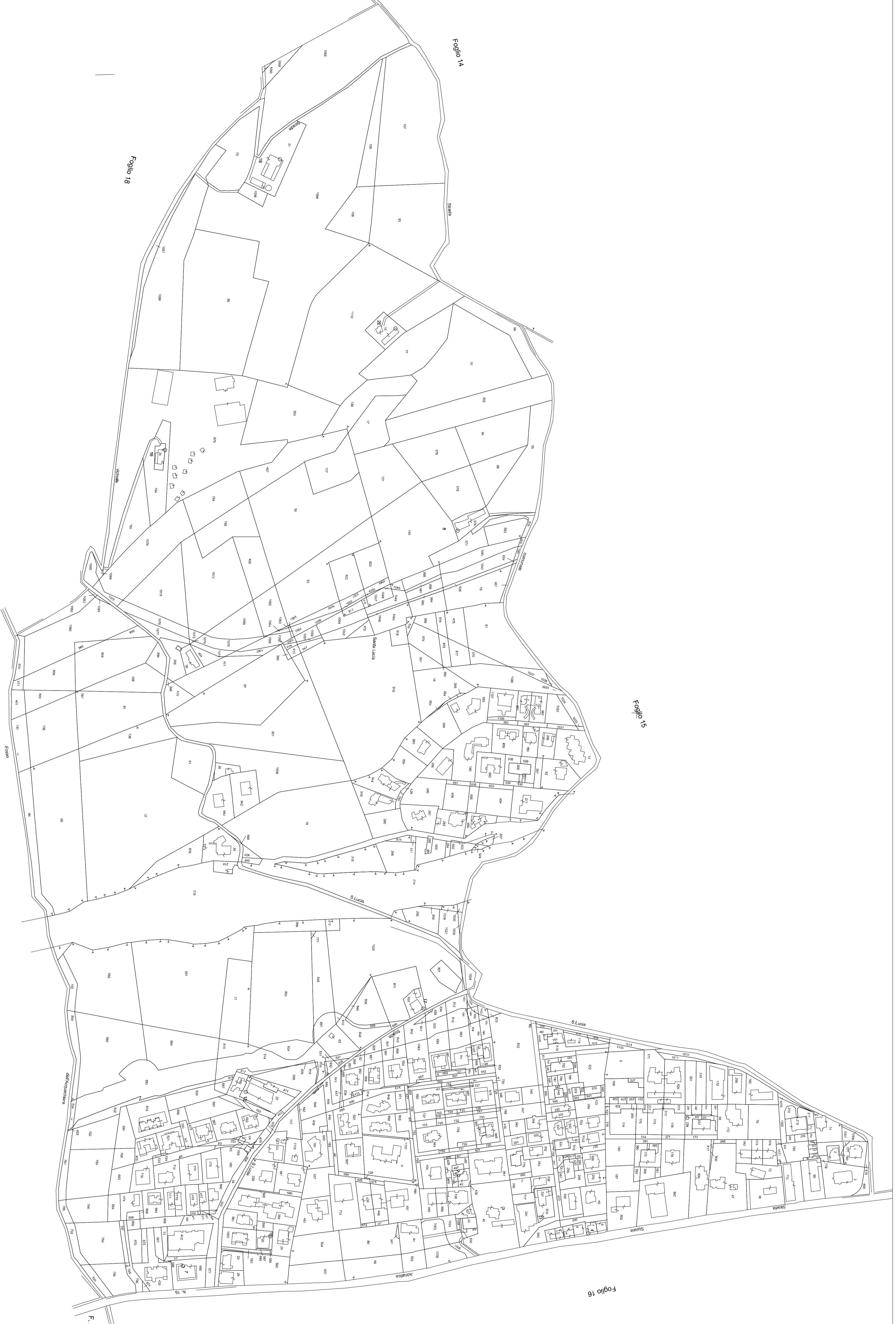
MAPPA CATASTALE - FOGLIO 17