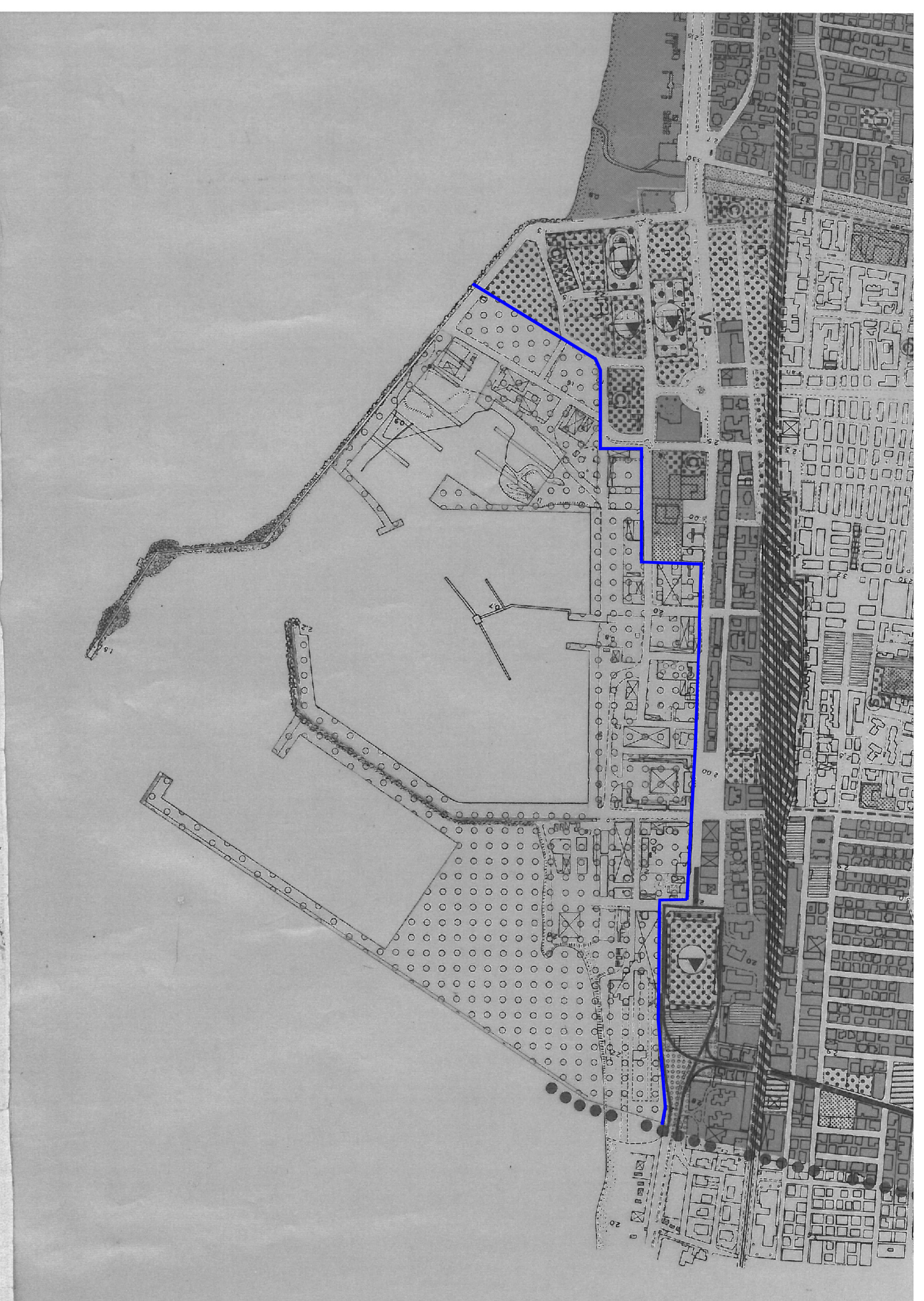
Limite ambito portuale secondo il P.R.G. vigente