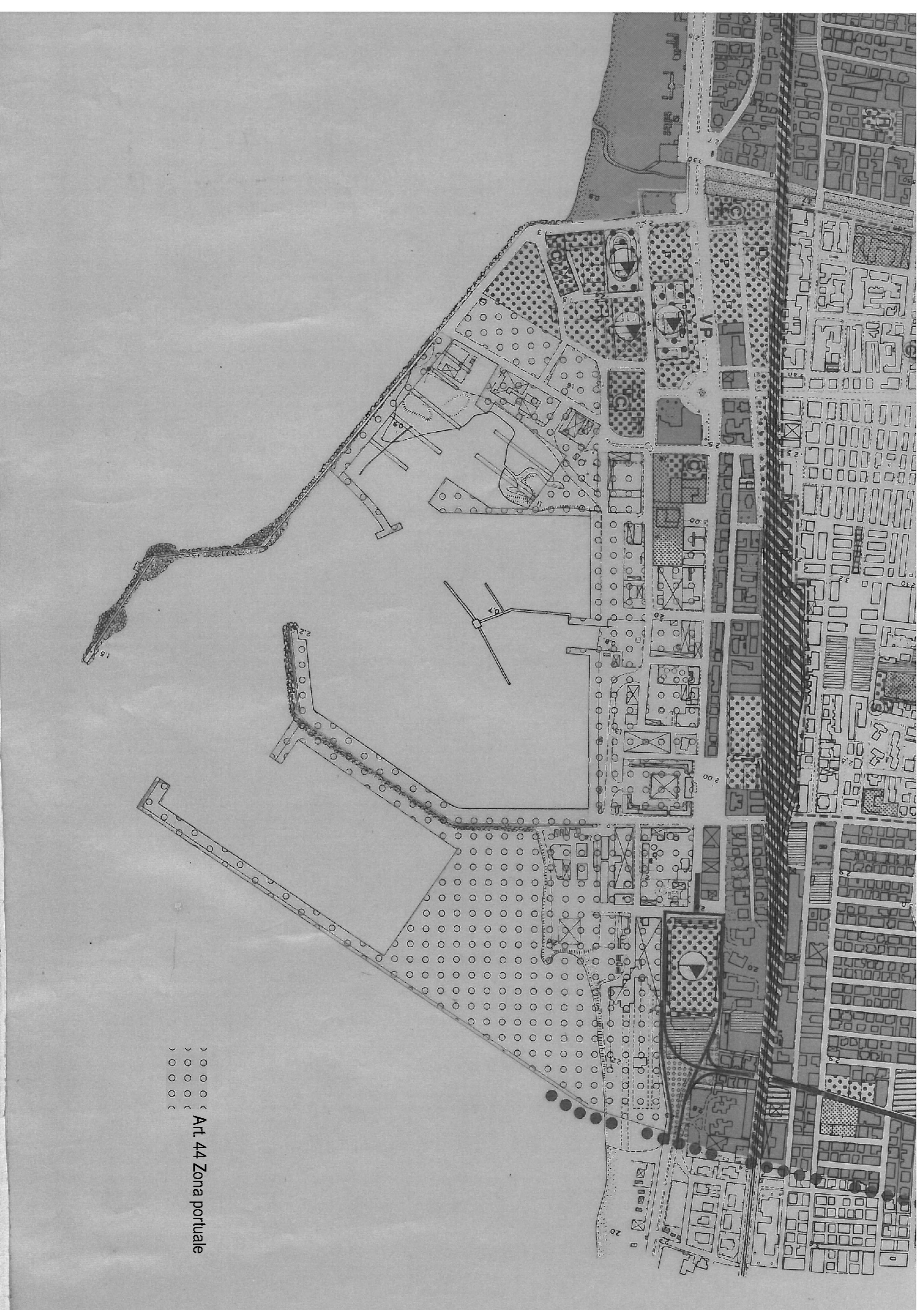
Zonizzazione del P.R.G. vigente