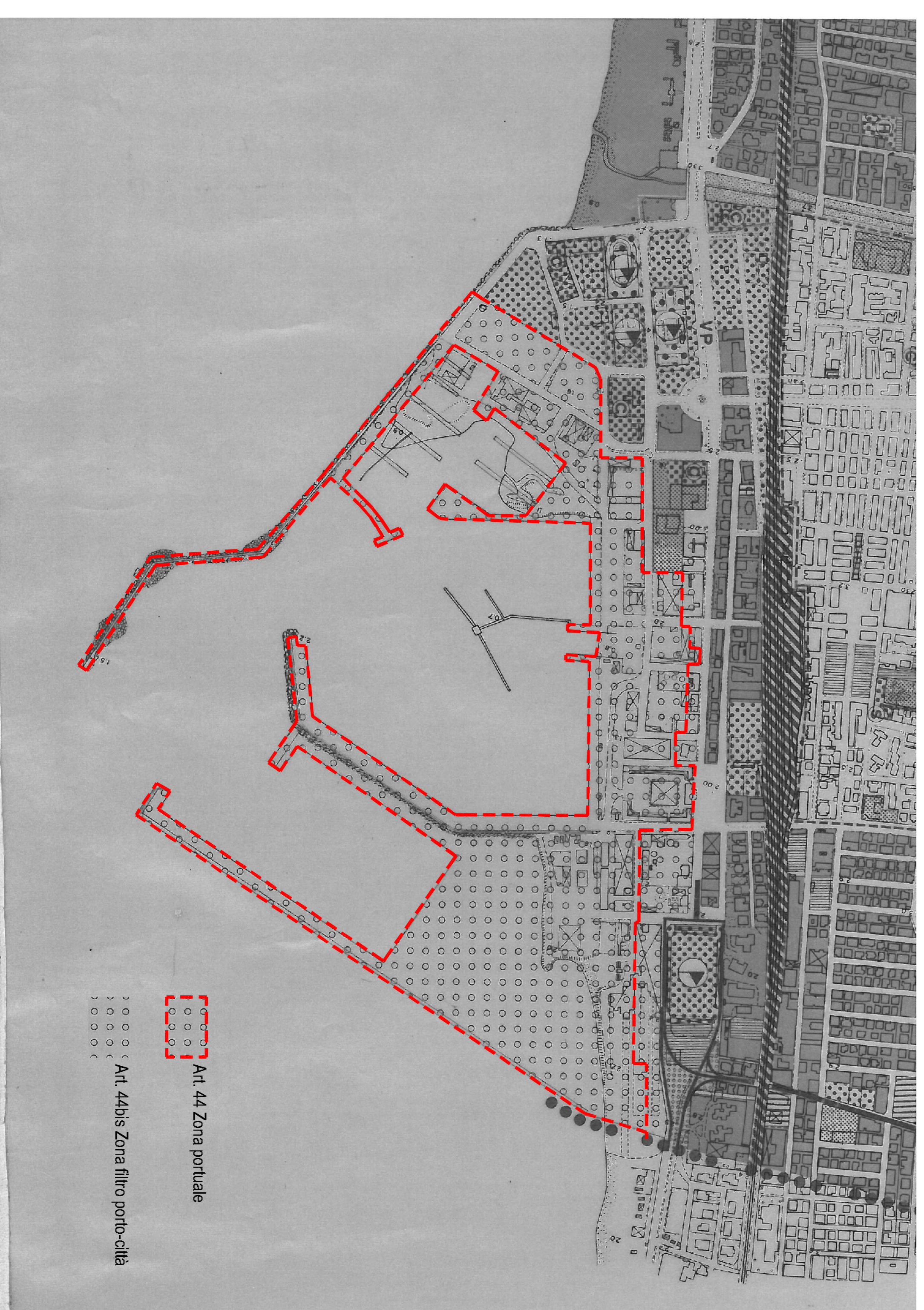
Zonizzazione di progetto