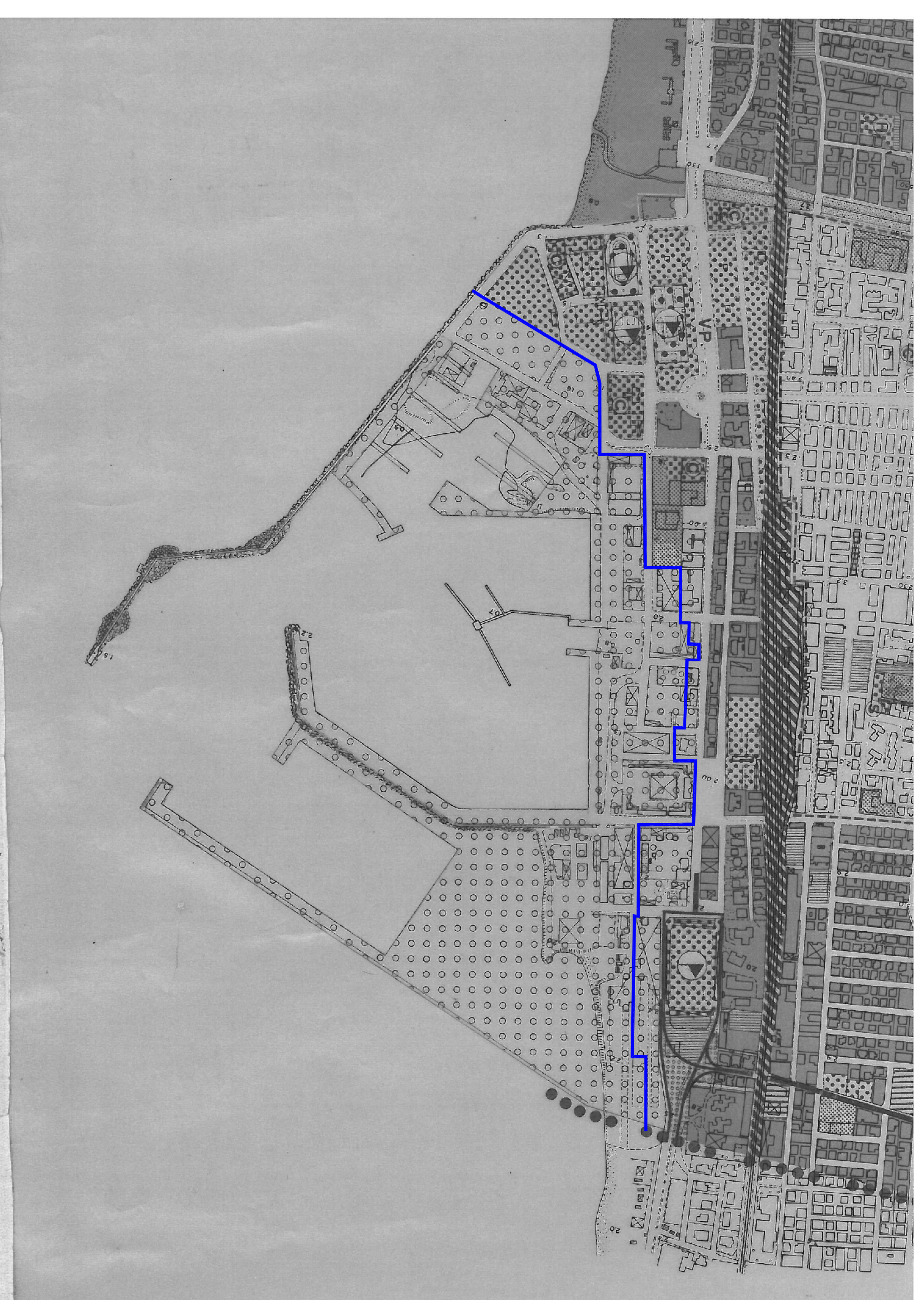
Limite ambito portuale di progetto secondo il nuovo P.R.P. approvato ai sensi dell'art.5 della legge 28 Gennaio 1994 n.84