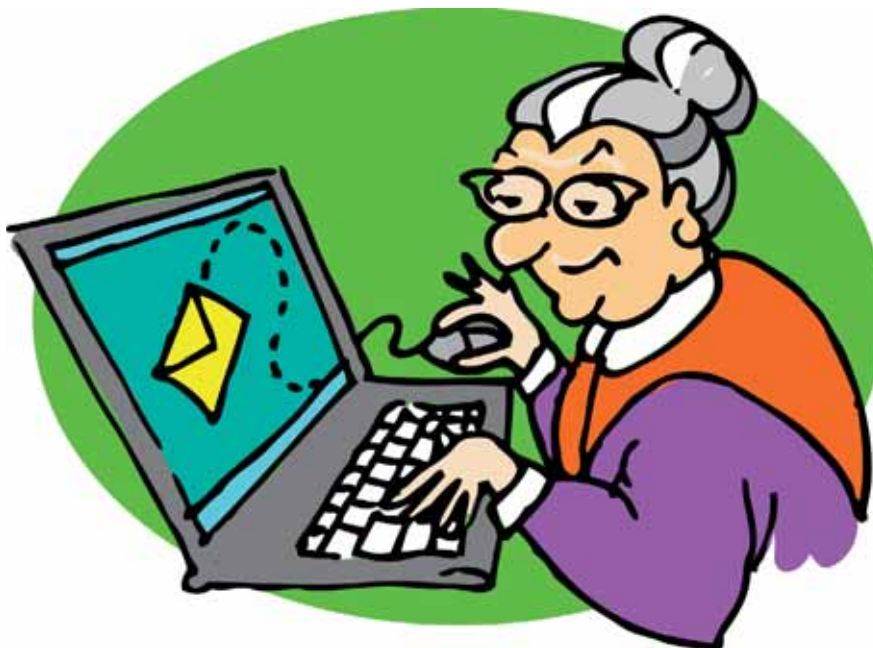
disegno di Belinda Menzietti

Si prevede che entro quest'anno oltre 45 milioni di persone saranno presenti sul sistema ANPR. Ma quali saranno i vantaggi per noi una volta che il processo di migrazione sarà terminato?