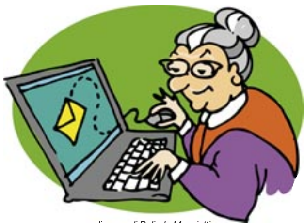
disegno di Belinda Menzietti

San Benedetto del Tronto è un Comune certificato