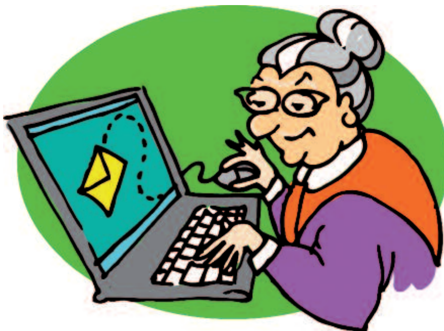
disegno di Belinda Menzietti

Soluzioni? Di sicuro più d'una, ma quella che si basa su un paradigma tutto nuovo è chiamata cloud , cioè nuvola. Consiste in servizi, raggruppati