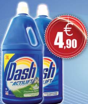
Dash Liquido - lt. 3