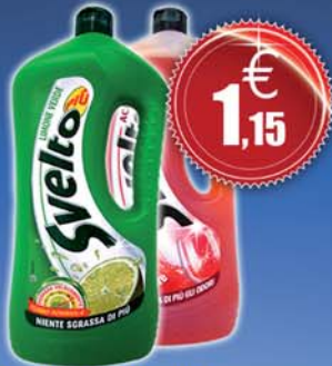
Svelto Piatti - lt. 1