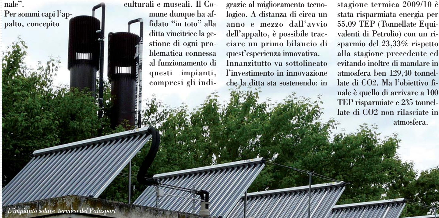
L'impianto solare termico del Palasport

Buona parte di questi investimenti è già stata effettuata e i risultati sono evidenti: nella stagione termica 2009/10 è stata risparmiata energia per 55,09 TEP (Tonnellate Equivalenti di Petrolio) con un risparmio del 23,33% rispetto alla stagione precedente ed evitando inoltre di mandare in atmosfera ben 129,40 tonnellate di CO 2 . Ma l'obiettivo finale è quello di arrivare a 100 TEP risparmiate e 235 tonnellate di CO 2 non rilasciate in atmosfera.