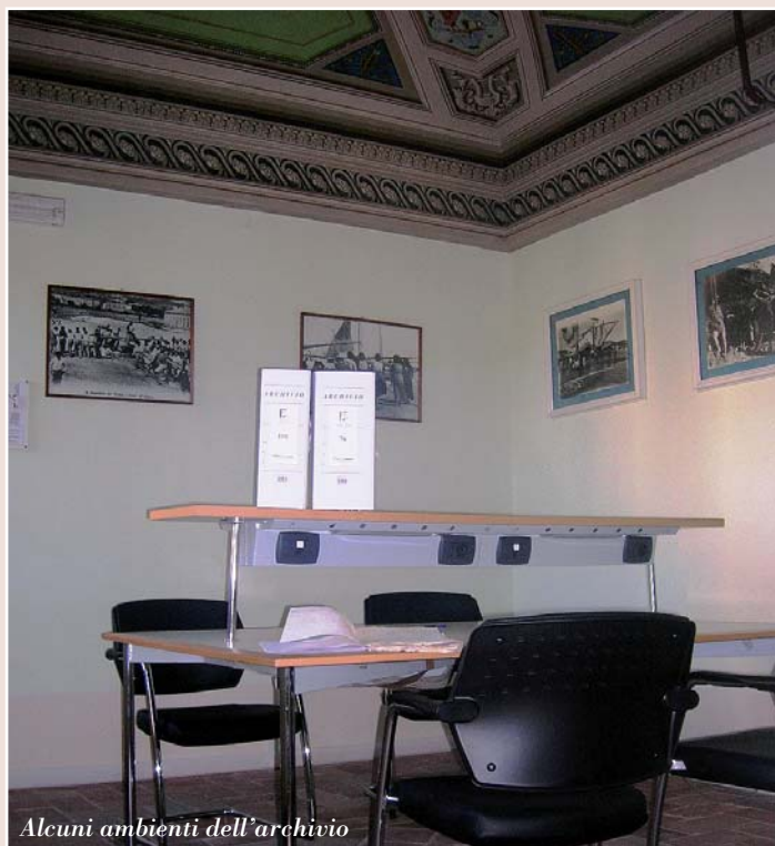
Alcuni ambienti dell'archivio

Ricordiamo che l'Archivio Storico Comunale conserva i documenti prodotti o acquisiti dal Comune di San Benedetto nel corso della sua attività dal XVII al XX secolo (1970 circa). Il complesso documentario, che ovviamente è a disposizione della cittadinanza e di studiosi all'inter-