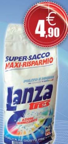
Lanza - 70 misurini