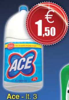
Ace - lt. 3

Via Piemonte 23 - MARTINSICURO TE - tel. e fax 0861 760549 - 737791 - 393 9705916 NEGOZIO: h. 9.00 / 13.00 - 16.00 / 20.00 APERTO ANCHE IL SABATO