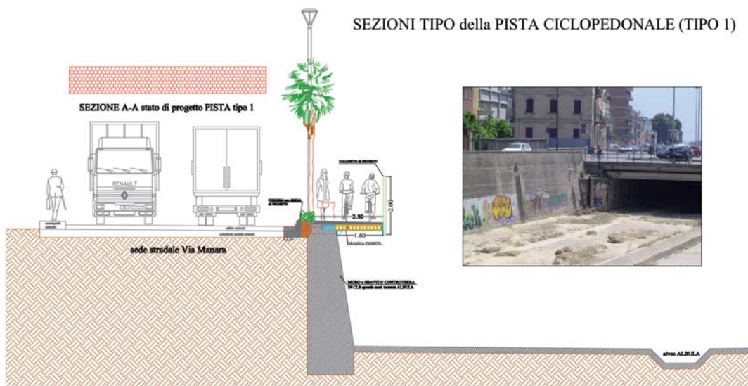
SEZIONI TIPO della PISTA CICLOPEDONALE (TIPO 1)

profonda, con eleganza, discrezione e praticità. Non prima, però, che venga completata la messa in sicurezza del torrente, onde evitare che un'eventuale piena possa rovinare i lavori in corso.